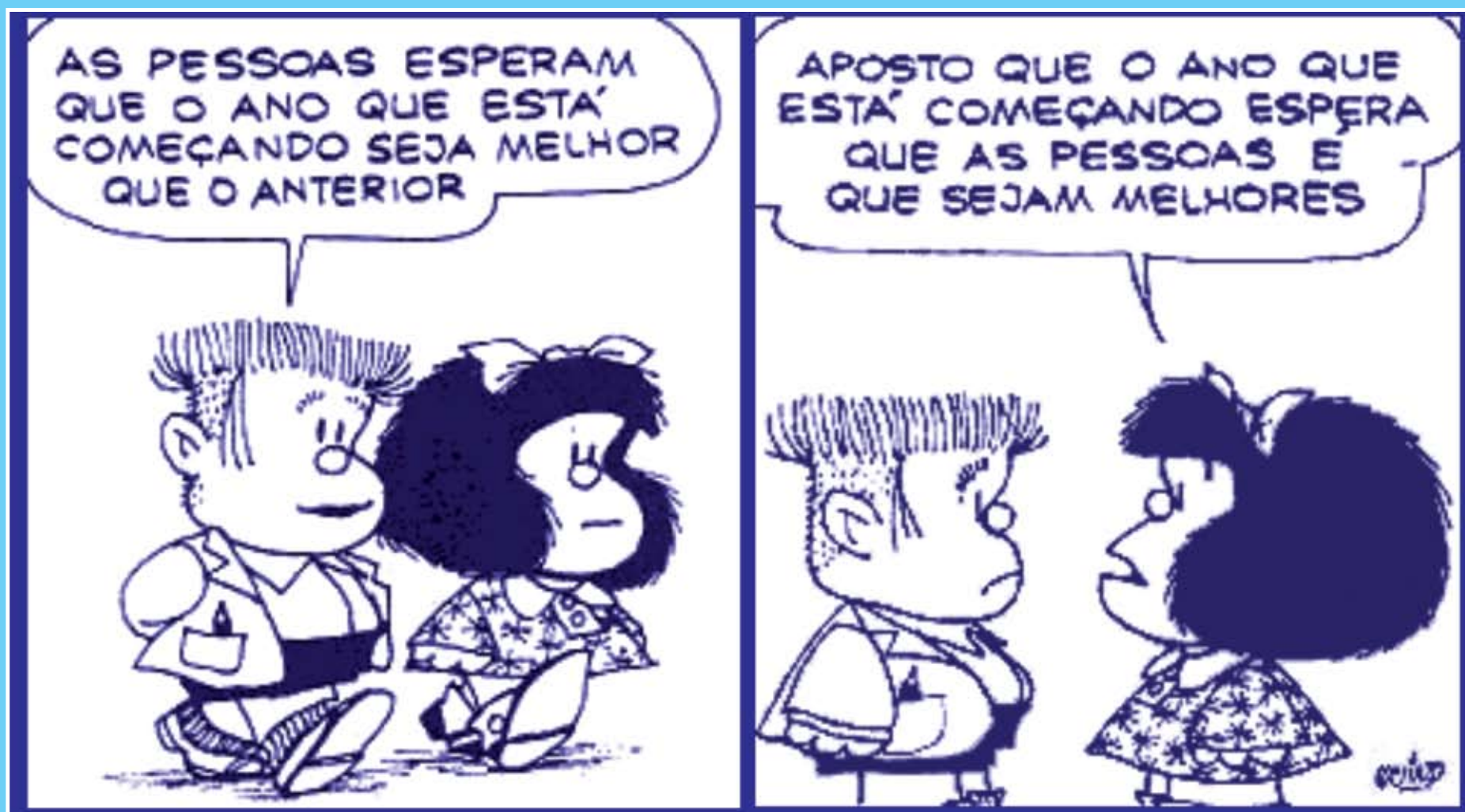
Tirinha de quadrinhos da famosa personagem Mafalda, do genial cartunista argentino Quino, veiculada na internet