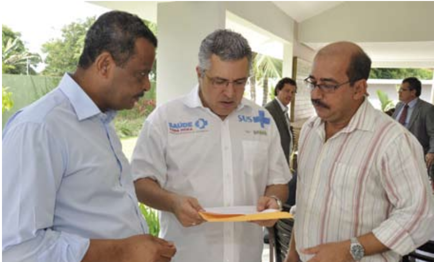
Dirigentes do Sindsprev-PE entregam documento ao ministro Alexandre Padilha solicitando apoio na Mesa Setorial Permanente de Negociação da Saúde

O coordenador geral do Sindsprev-PE, José Bonifácio, entregou no dia 19 de dezembro, ao Ministro da Saúde Alexandre Padilha, documento solicitando-lhe apoio na Mesa Setorial Permanente de Negociação da Saúde.