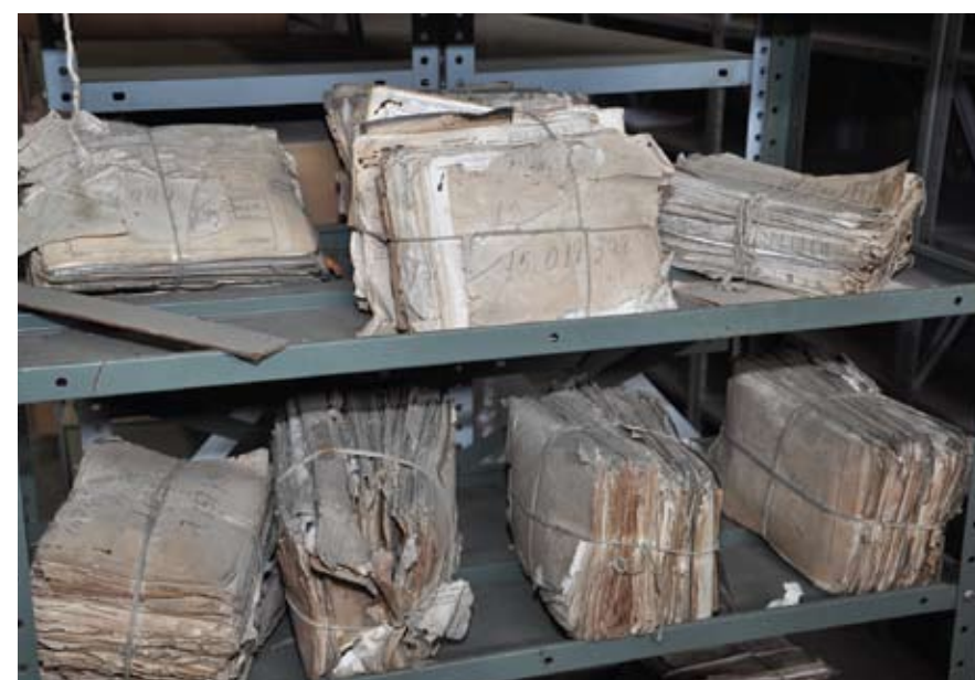
Documentos estão se estragando no Cedocprev do INSS