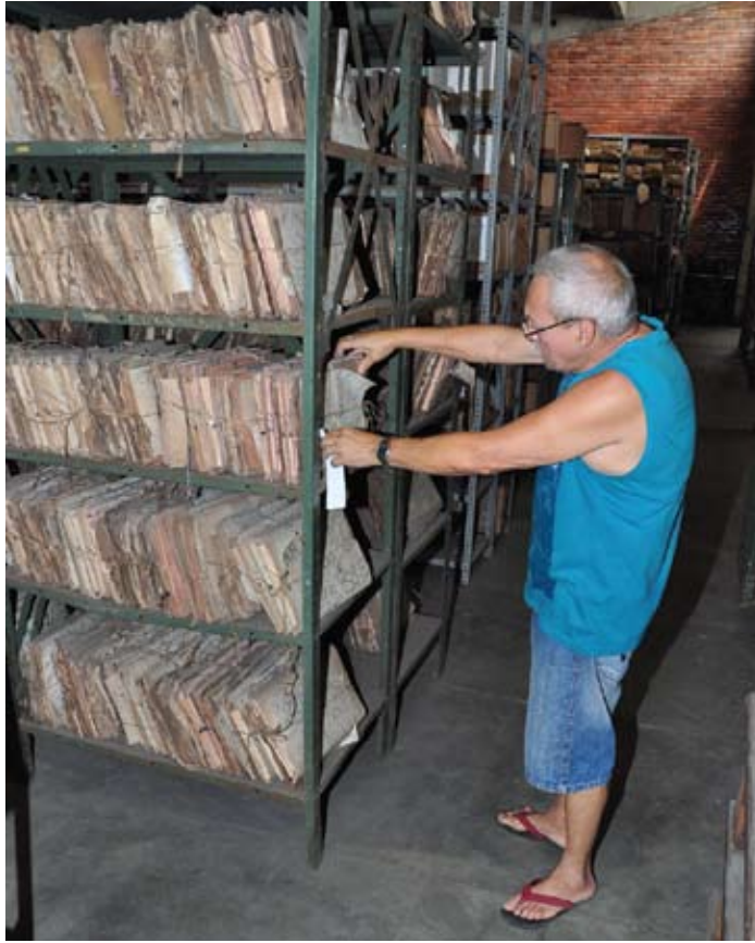
Servidores trabalham de bermuda e camiseta para suportarem o calor dentro do Cedocprev

Outra queixa é a falta de equipamento, como álcool em gel para assepsia das mãos, lu-