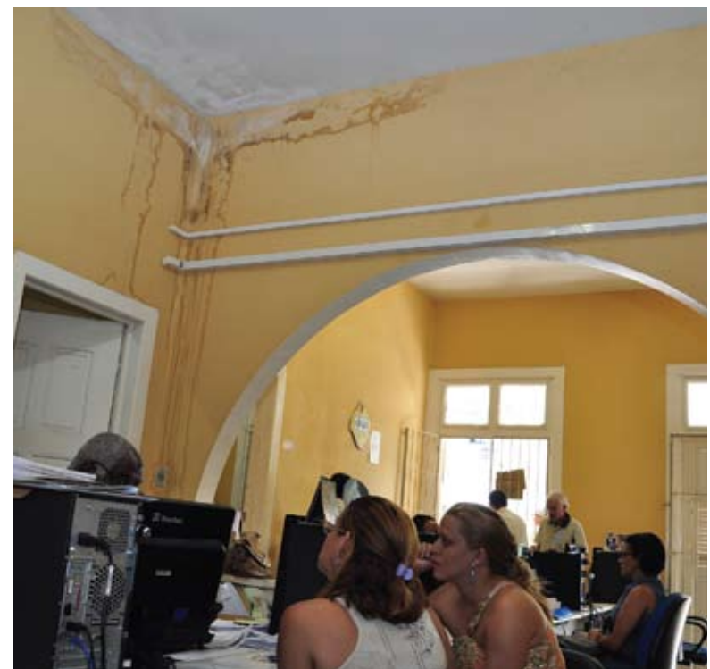
Calor e paredes com infiltrações fazem parte do dia a dia da APS de Moreno

Pela propaganda do governo a meta do INSS é atender cada vez melhor aos segurados, mas não lembram que os servidores trabalham em péssimas condições nas APS's. Esta situação tam-