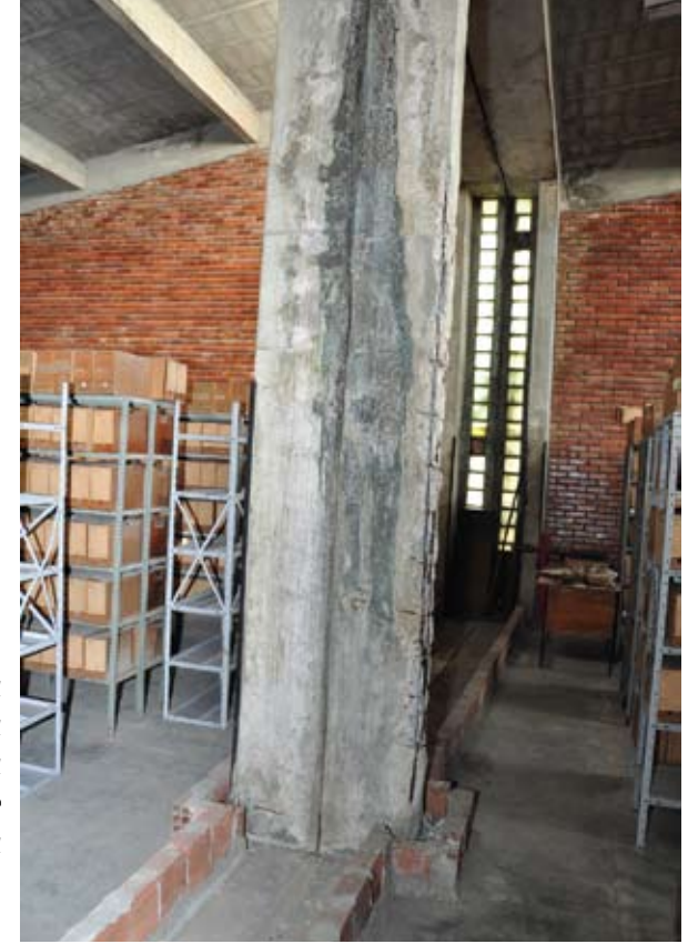
O espaço está com a estrutura das colunas à mostra e enferrujada

vas, toucas e máscaras que deveriam ser usadas para proteger os trabalhadores contra as bactérias e fungos que aparecem em locais com grande quantidade de papel. No Cedocprev estão arquivados mais de 600 mil processos, muitos das décadas de 30 e 40. Alguns servidores já apresentaram problemas de saúde por estarem expostos a uma área insalubre, onde proliferam vírus e bactérias.