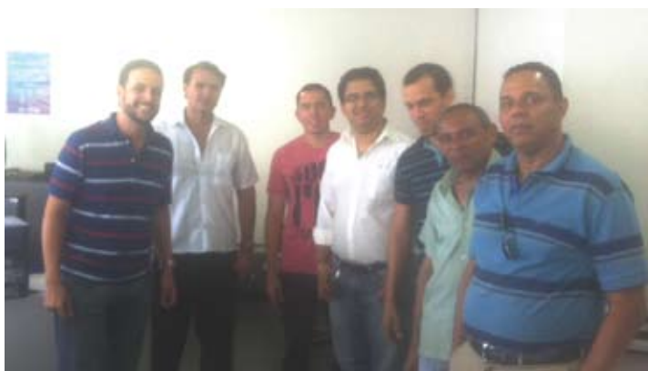
APS Bom Conselho

Ratificamos a importância da continuidade destas visitas com mais frequência, de acordo com a necessidade e solicitação da própria categoria.