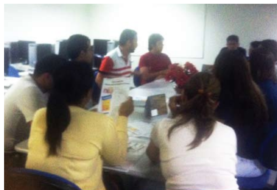
Reuniões com servidores no interior