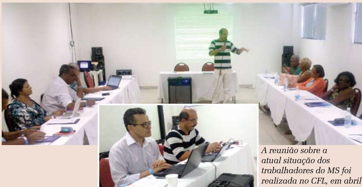
A reunião sobre a atual situação dos trabalhadores do MS foi realizada no CFL, em abril