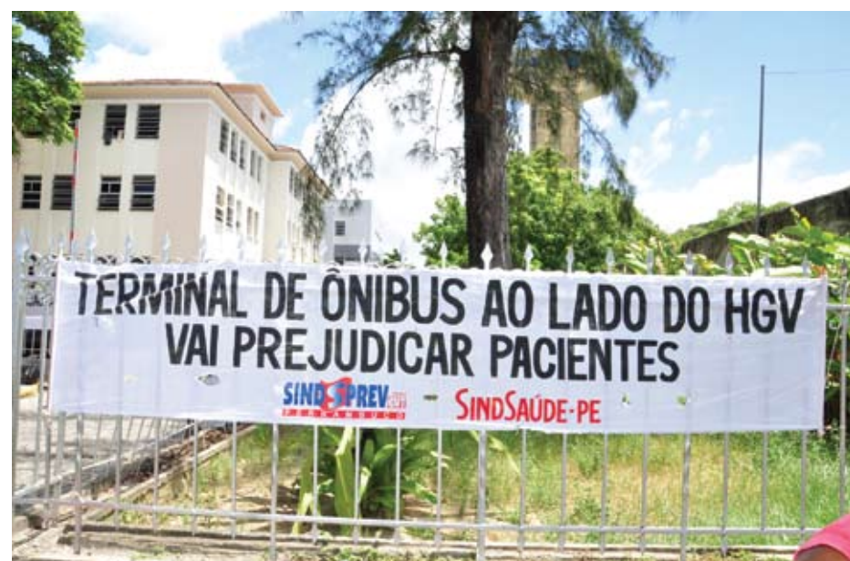
Instalação de terminal de ônibus prejudicará a saúde de pacientes