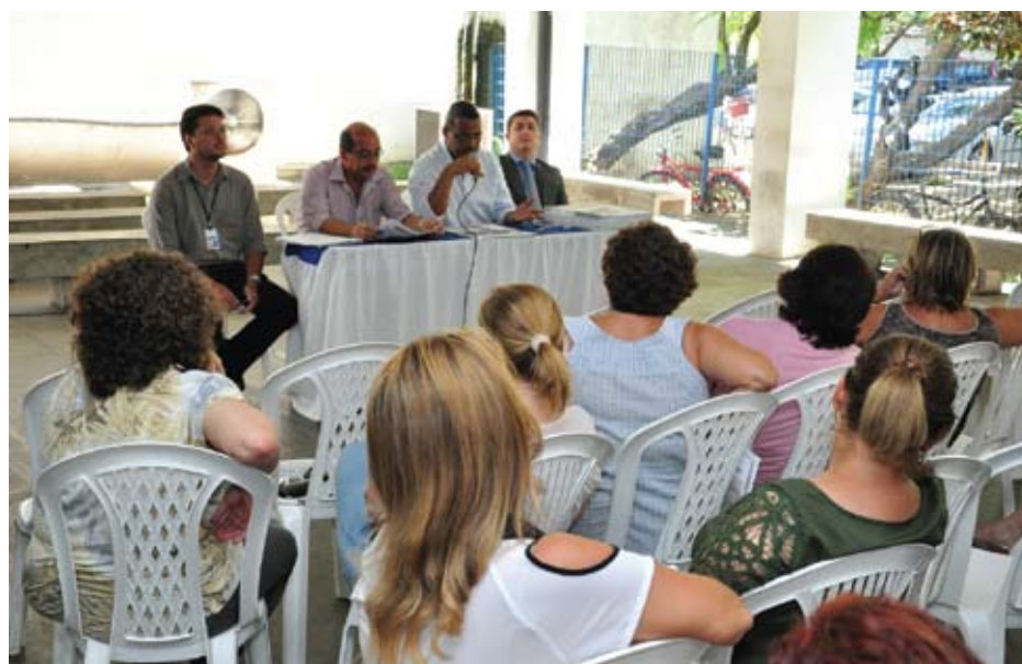
Assembleia na Gerência Recife sobre a permanência do turno estendido

Confira as matérias divulgadas neste número do Jornal do Sindsprev sobre esses importantes temas.